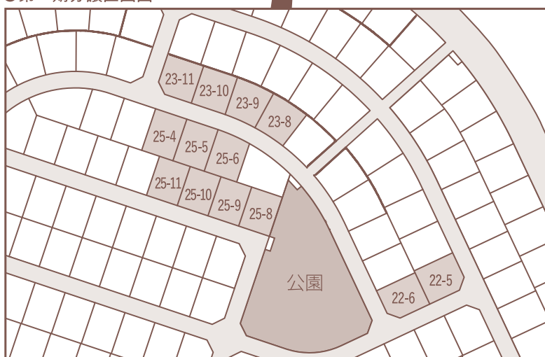
第二期建築条件付宅地分譲区画